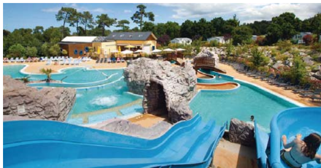
Espace Aquatique Camping Les Pins, Erquy

L'Hébergement des stagiaires se fera sous tentes.